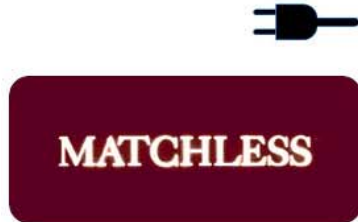
ampli de guitarra